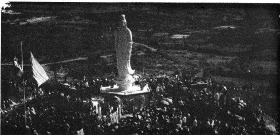
TƯỢNG PHẬT BÀ QUAN ÂM TẠI PHÚ HẢI ( BÌNH THUẬN ) TRƯỚC ↑ VÀ SAU ↓ NGÀY 30-4-1975

Tháng 9-75, Ty Giáo dục Trung Nghĩa buộc giao trường học và ký nhi viện Phật Giáo, còn nói : "Tôn giáo không có quyền đưa ra điều kiện nào hết, chỉ có chính quyền mới có thể đưa ra điều kiện nếu cần thì đóng cửa chùa lại". (Lời ông trưởng ty Giáo Dục). (21-10-75, P. 1)